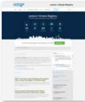
Sitio del cCR

Debido a que el eje temático del Desafío de Ciudades 2017-2018 es transporte urbano y movilidad, se busca que las ciudades también llenen su perfil de movilidad en el apartado “datos de movilidad”, que se encuentra dentro de la hoja de informes. Al hacerlo, una ciudad está proporcionando información sobre sus acciones de movilidad, lo cual es un requisito si una ciudad desea ser reconocida exclusivamente por su compromiso e implementación de acciones para promover la movilidad sustentable.